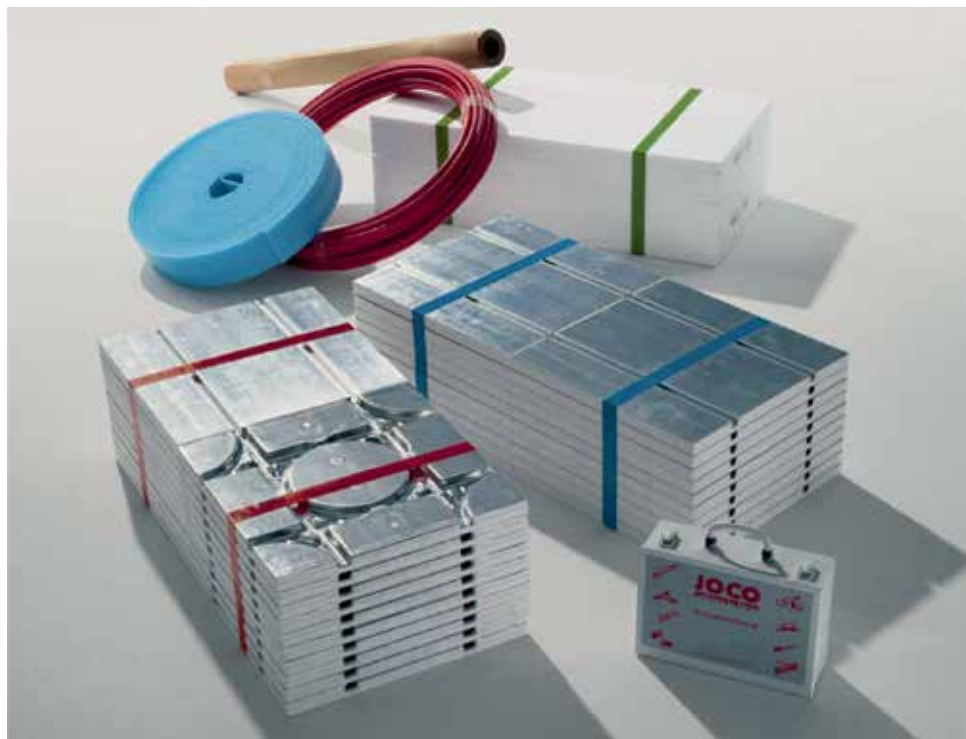
JOCO KlimaBoden TOP 2000/ÖKOpor. Die Schichtbauweise und das Komplettpaket passt zu jedem Bauvorhaben und vermindert Planungs- und Baukosten.

JOCO – Kompromisslos, wenn sich alles um gleichmässige Bodenwärme dreht.